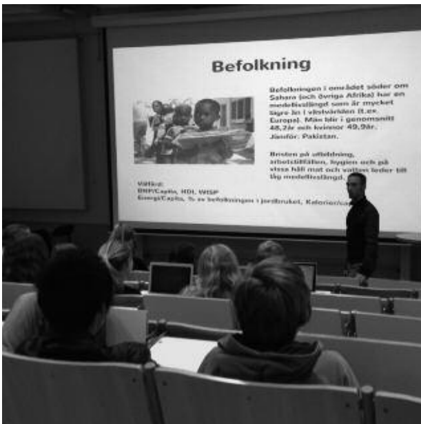
Föreläsning för högstadieungdomar.

och några lumparkompisar tyckte att det var en bra idé att passa på, så vi gick en kurs i Örebro Fallskärmsklubb 2001.”