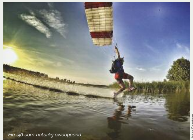
Fin sjö som naturlig swooppönd.