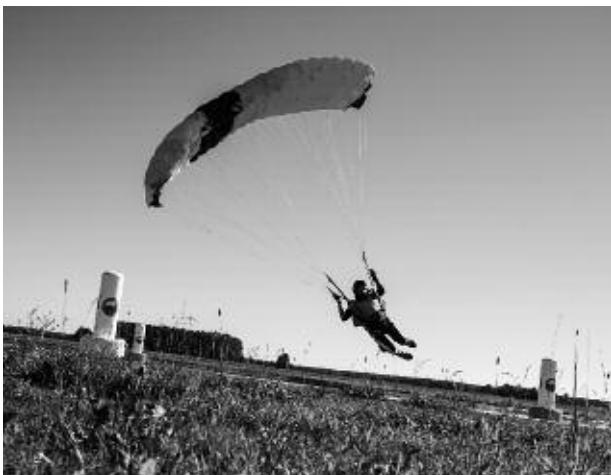
Swooptävling över Gryttjoms pond.