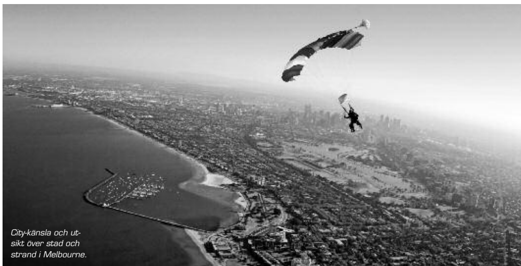
City-känsla och utsikt över stad och strand i Melbourne.