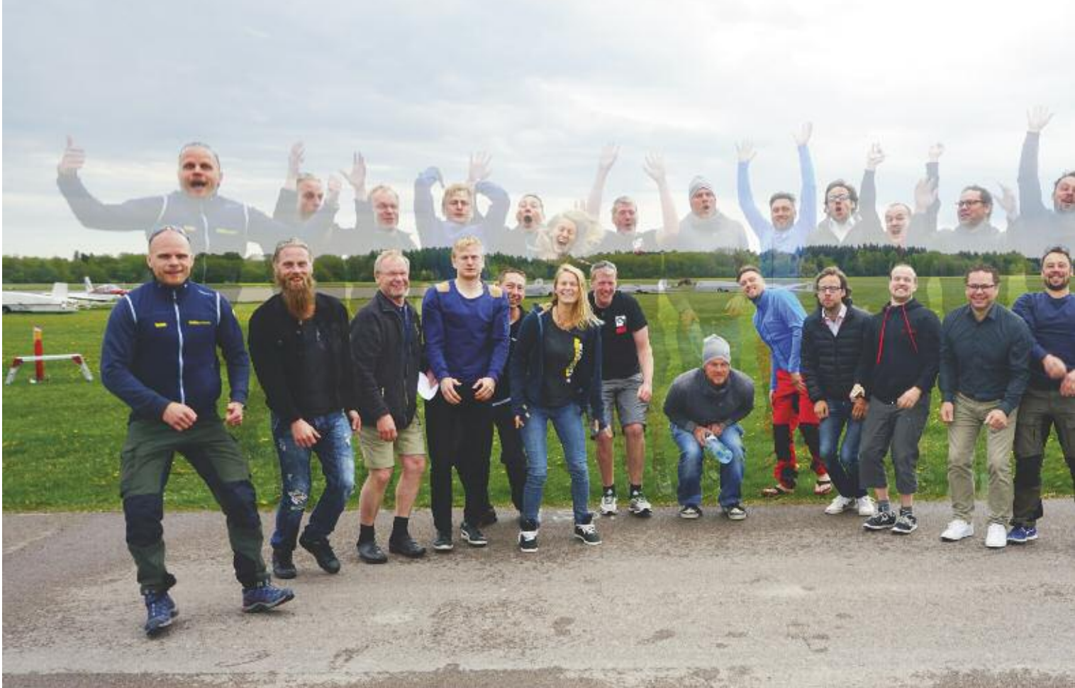
Det klassiska fotohoppet – här utfört av årets deltagare på tandemutbildningen.

Svenska Fallskärmsförbundet har, i samarbete med Svenska Flygsporförbundet och Riksidrottsförbundet, ett premieringssystem för medlemmar som tävlar och sätter tävlingsrekord. Förtjänststecken är till för att premiera även andra fallskärmsrelaterade prestationer och insatser som gagnar SFF. Förtjänststecken finns i valörerna guld, silver och brons. Bestämmelser för förtjänststecken och utdelningskriterier hittar du på: http://sff.se/fortjanst