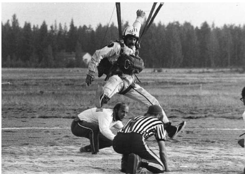
"1971. Medvindsländning med PC. Lagg märke till tiocentimetersplattan under foten."