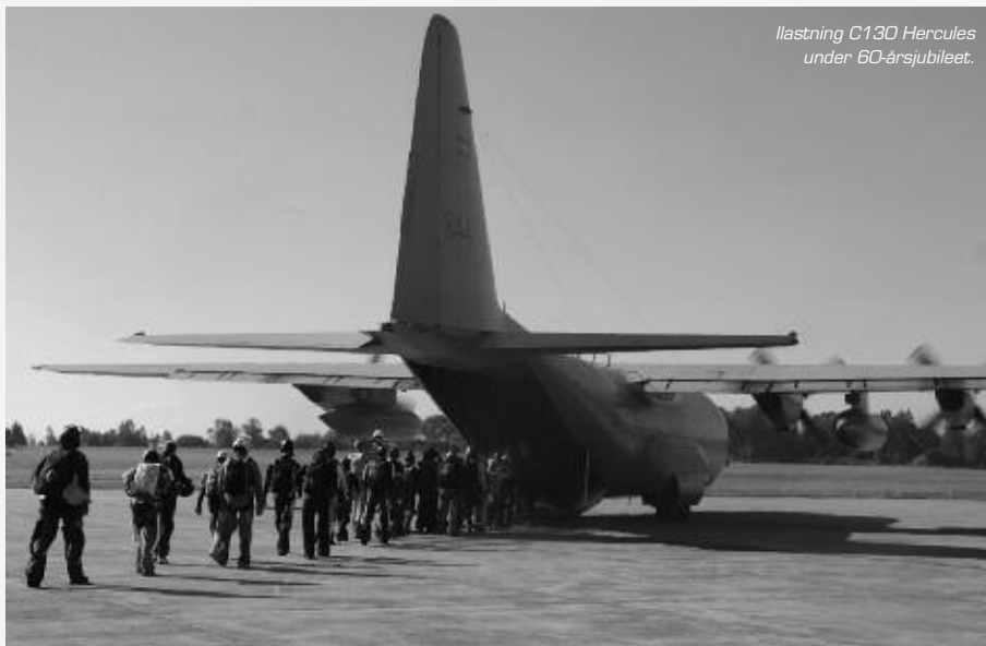
llastning C130 Hercules under 60-årsjubileet.

Hela idén är att skapa en händelse som kan föra fallskärmsverige närmare varandra och finna mål och mening. Tanken är att hitta vägar för att få fram ett relevant och funktionellt uttagningssystem, där kriterier och krav är tydliga vid rekrytering till stora rekordförsök. Kanske