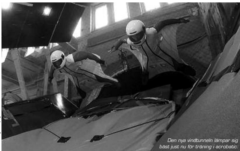
Den nya vindtunneln lämpar sig bäst just nu för träning i acrobatic.