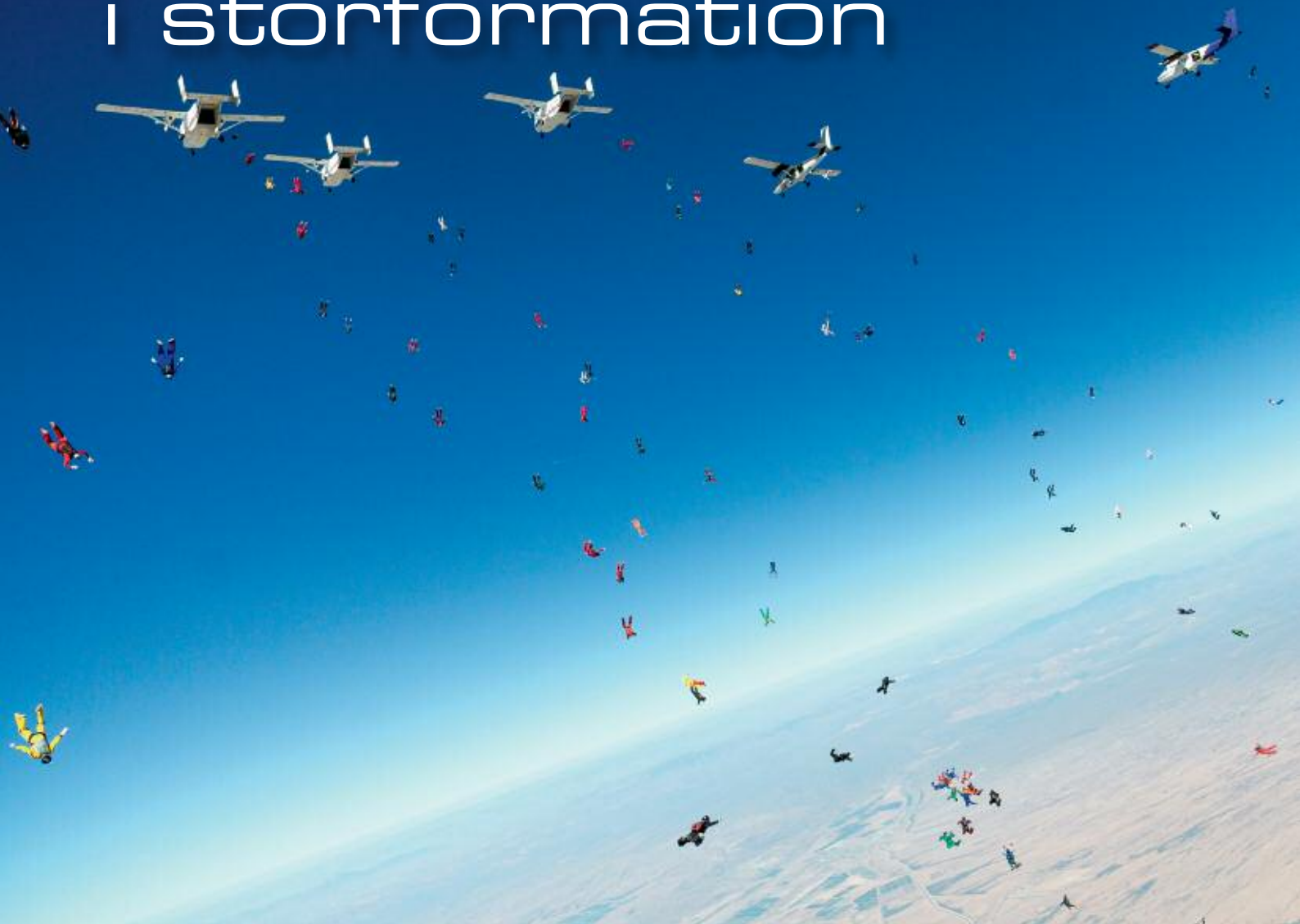
Pöång 1, FS 217