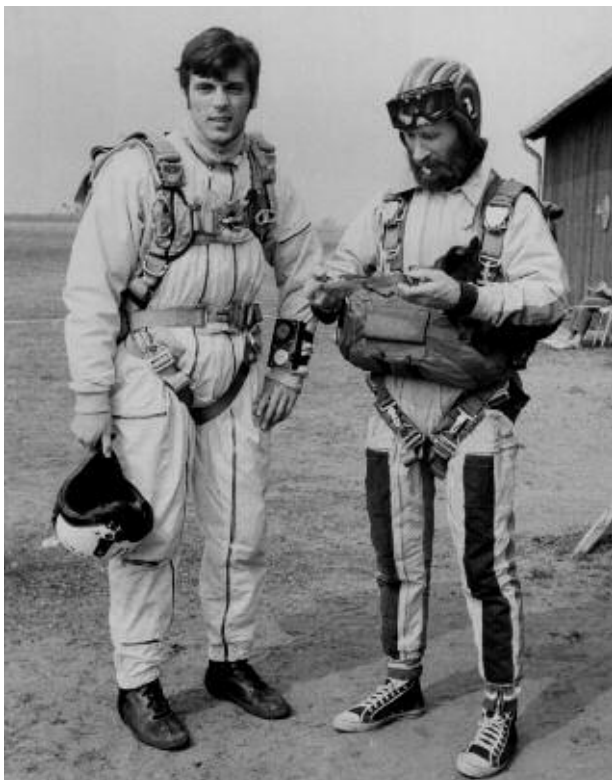
”1971. Legenden Roch Charmet och jag har bytt riggar. Första piggybackhoppet i Sverige (både huvudskärm och reserv på ryggen, reds anm.). Roch hade då, enligt vad han sa, flest hopp i världen och hoppade alltid med en blomma i munnen. Tyvärr dog han 1989 under sitt 14 650:e hopp, även det mest i världen då. Lägga märke till min utrustning, som Charmet har på sig, med magreserv och för cutaway så kallad 'one and a half shot release'.”