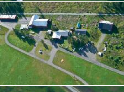
Östersunds klubbens hoppfält är stort och elevvänligt.