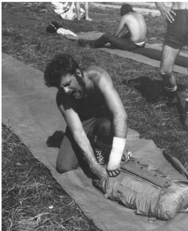
1968. Min första rigg. En Dubbel-L, DL, i en gammal surplusrigg. Armen bröt jag dagen innan.

fan på att visa att en gammal gubbe som jag kan nå upp i världseliten”, säger han.