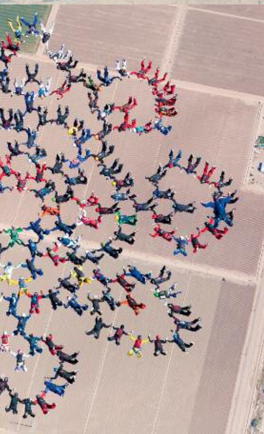
Poäng 3, FS 217