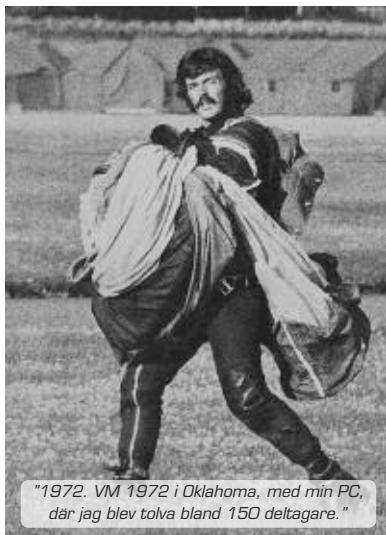
"1972. VM 1972 i Oklahoma, med min PC, där jag blev tolv bland 150 deltagare."

lockade, som att flyga små plan – jodå, han flög fallskärms hoppare under en period – och att segla över Atlanten.