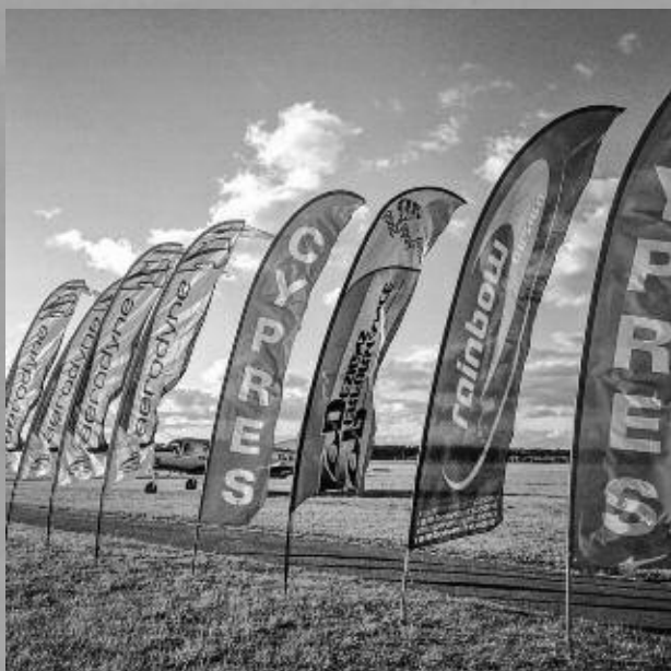
Vimplar från några av utställarna.