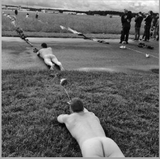
Midsommarlekar – här syns det berömda klädstrecket.