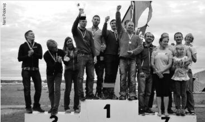
På pallen i FS4 klass AAA: Gryttjom Whuhuu respektive Gryttjom Volo, båda lagen från Stockholms Fallskärmsklubb, samt bronsmedaljörerna Aurora från Linköpings Fallskärmsklubb.