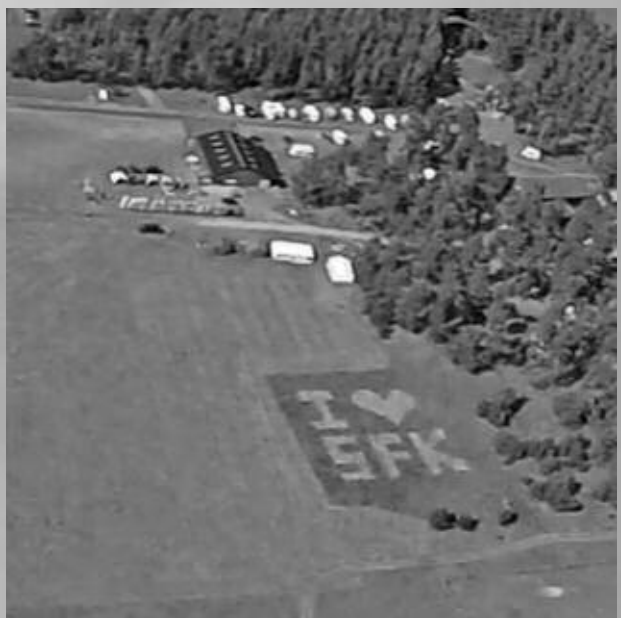
Skånes fallskärmsklubb – Everöd utanför Kristianstad.