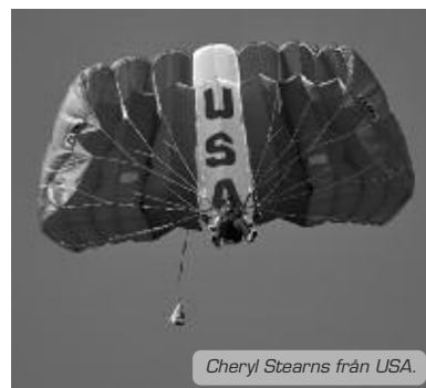
Cheryl Stearns från USA.

När tävlingen var över var det prisutdelning. Traditionella medaljer utdelades till