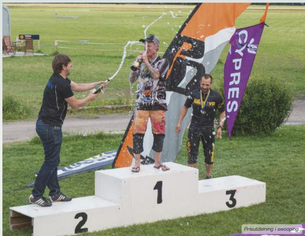
Prisutdelning i swooping.