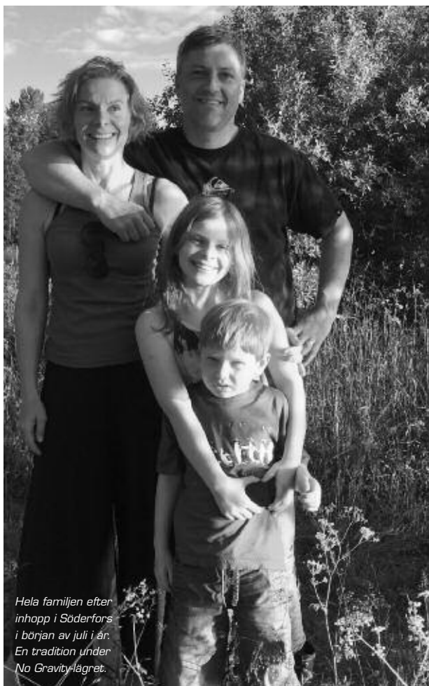
Hela familjen efter inhopps i Söderfors i början av juli i år. En tradition under No Gravity-lägret.