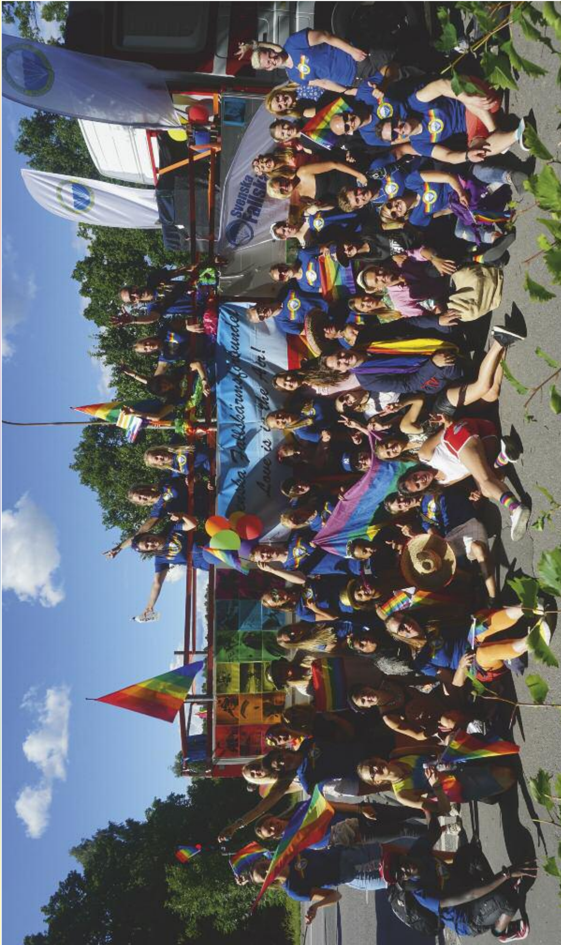
Cirka femtio deltagare prydde flygsport- och fallskärmsförbundets flak på årets Pridefestival i Stockholm.