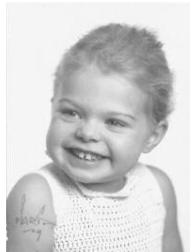
Boel hos fotografen i Göteborg vid två års ålder.

”Hoppningen är möjligheternas sport. Det tar alltid en liten stund att ta de där mentala kliven. Att det inte spelade någon roll att det bara var killar som swoopade, jag kunde också. Det har hela tiden varit förekomsten av människor runt mig som trott på mig och gett mig kunskapen jag behövde. Det är hoppningen för mig! Både att få det, att bli sedd av andra. Samt att ge det vidare själv. Förutom att vara i frifall och uppleva elementet är det det som är hjärtat i hoppningen för mig.” ■