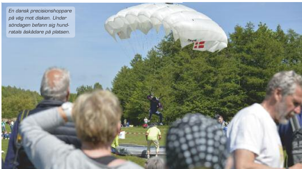
En dansk precisionshoppare på väg mot disken. Under söndagen befann sig hundratalens åskådare på platsen.