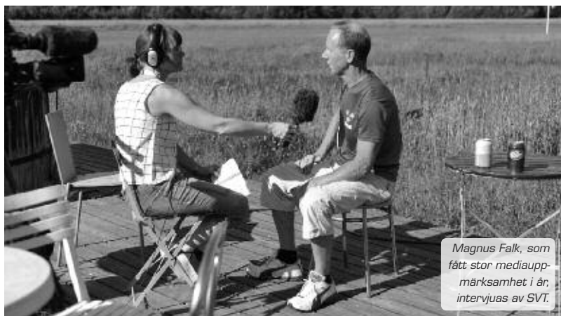
Magnus Falk, som fått stor mediauppmärksamhet i år, intervjuas av SVT.