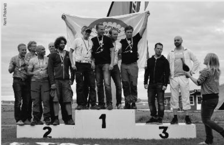
Lagen i fyrmanshoppningens klass A: Estrella Pop De Light, Gubbstön, och Kwansta Synchro.

SM-guld – sju i fyrmanna, en i åttaman- na och en i tiomanna speedformation.