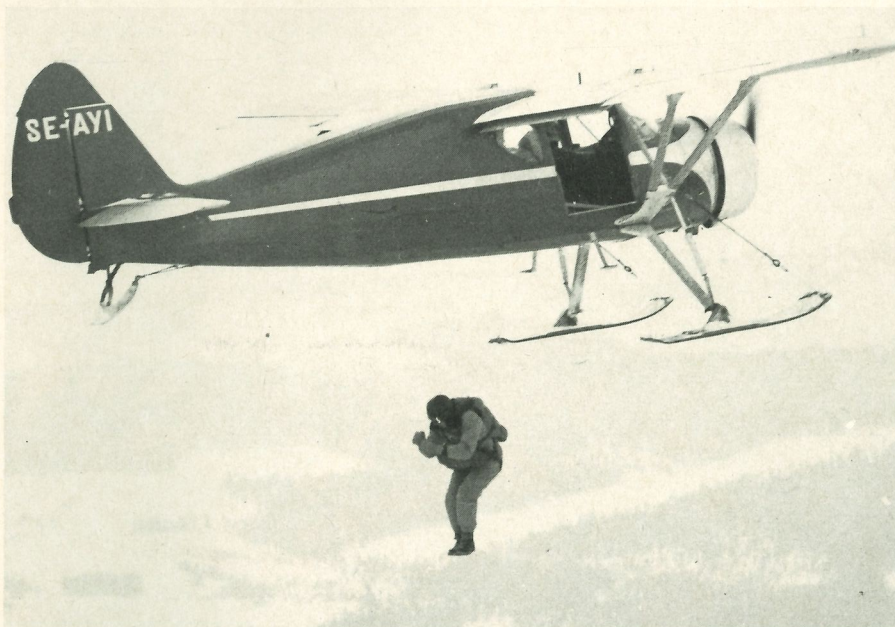
Olle Falckerheim har just lämnat flygplanet för klubbens premiärhopp. OBS! uthoppställningen, som då ansågs som den lämpligaste.

omarbetningar dessförinnan). Alla väsentliga säkerhets- och materielproblem behandlades liksom de ekonomiska planerna.