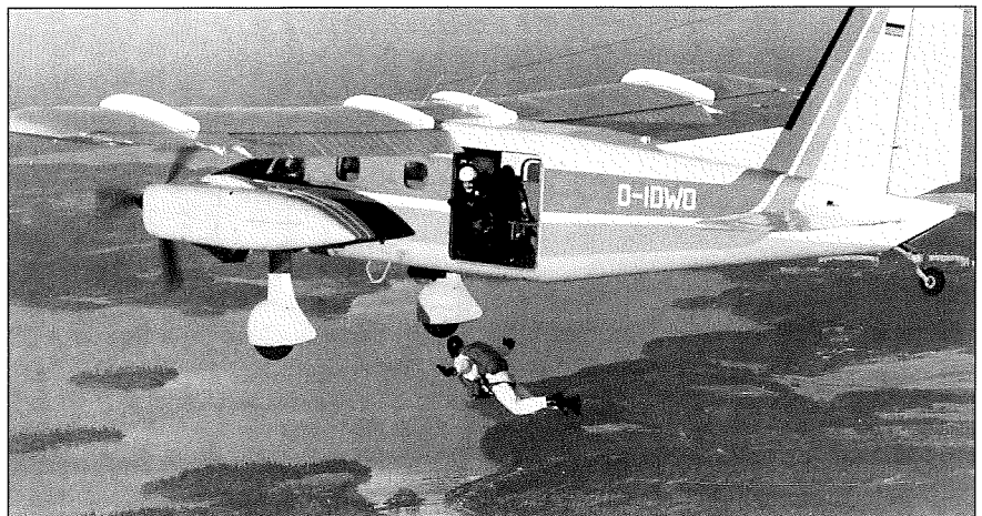
På magreservernas guldålder var RW, eller FS som det nu skall kallas, knappt uppfunnen. En i taget gällde mest. Fina flygplan är dock inget nytt påfund: här en tyskregistrerad Dornier.

Men säg de gulddagar som varar för evigt. Till slut var både idéer, tid, entusiasm, pengar och redaktörer utbrända. En ny tid tog vid. Kanske en