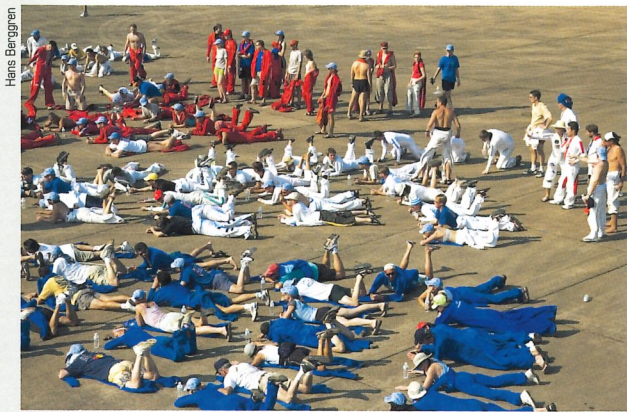
De svenska hopparna ingick i den "nordiska" sektor 8, där alla bar vita overaller. På förra uppslagets stora bild syns sektor 8 klockan sex, närmast kameran

På rampen, redo för exit, höjden är över 7 000 meter. Hjälmarna är specialgjorda för att fungera som syrgasmasker, med hjälp av en lösa slangar i planet.