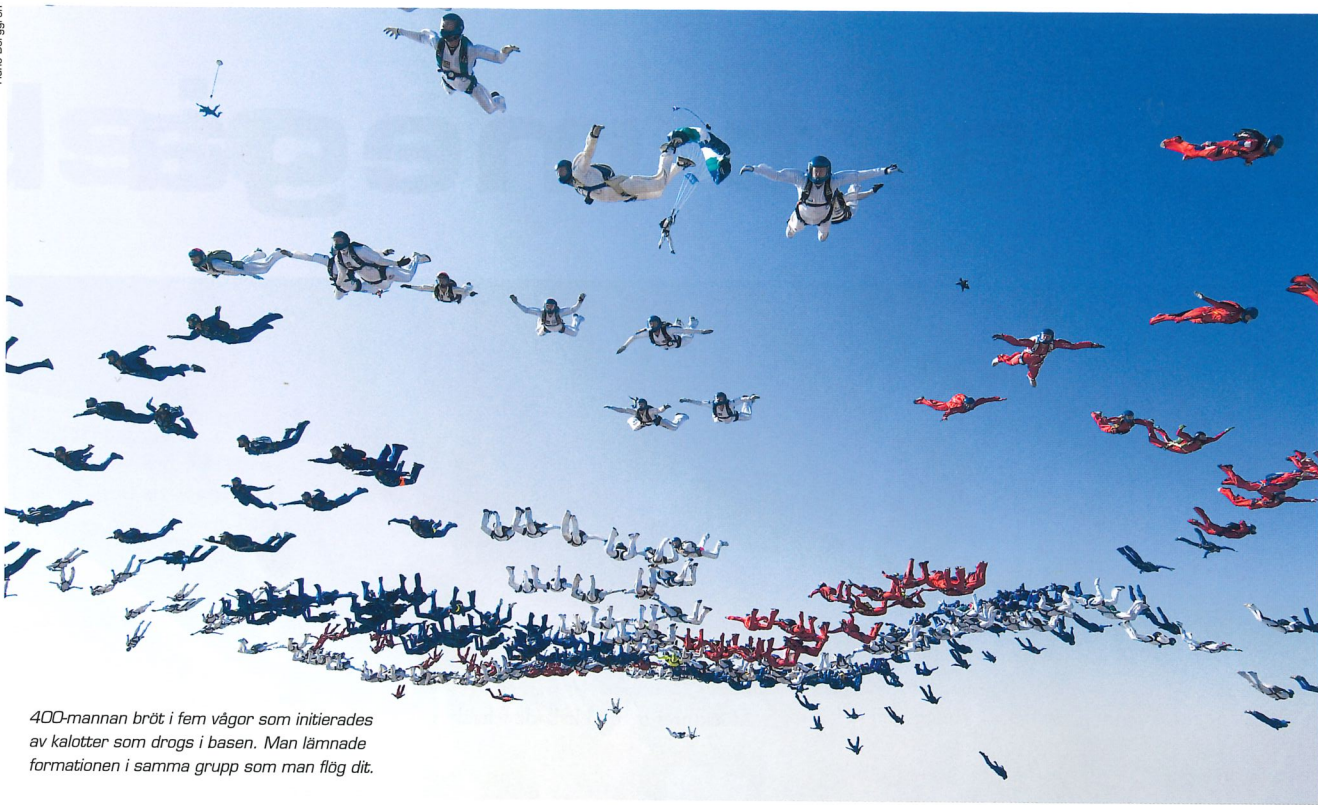
400-mannen bröt i fem vågor som initierades av kalotter som drogs i basen. Man lämnade formationen i samma grupp som man flög dit.

nedräkning av exit, kommando för att docka i olika vågor och för att kommentera olika fallhastigheter fanns också. Craig hade dessutom en display i sin hjälm med projicerad fartmätare.