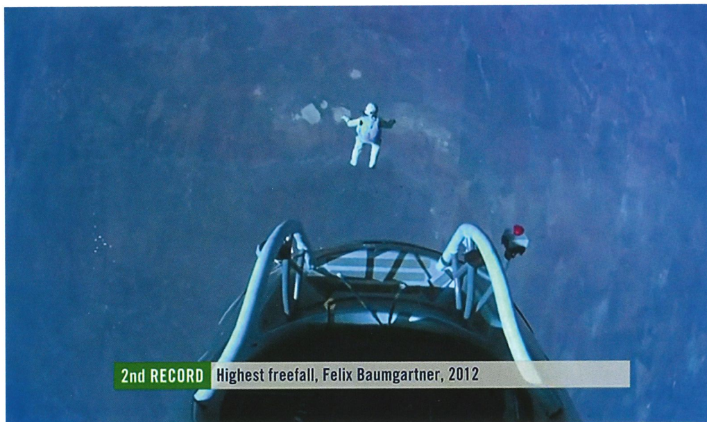
2nd RECORD Highest freefall, Felix Baumgartner, 2012