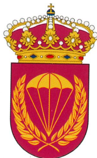
Svenska Fallskärmsjägarskolans emblem.