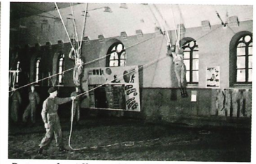
Det gamla ridhuset blev fallskärmsjägarnas övningshall.