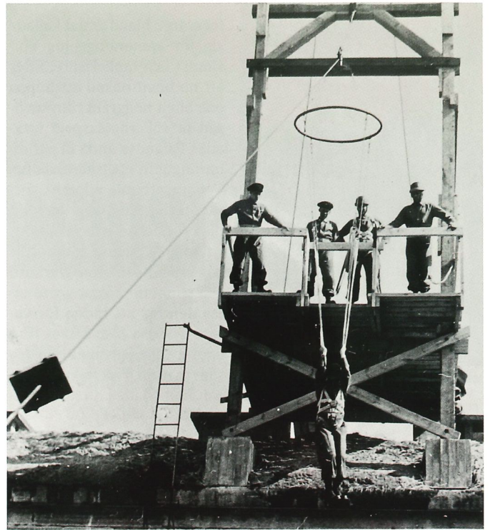
Landningar övades från torn.