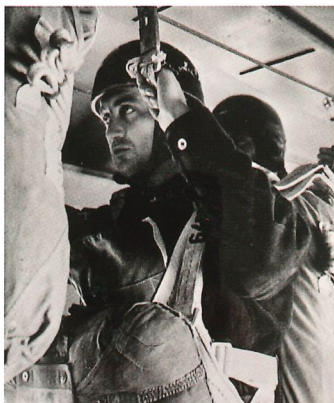
I väntan på att få hoppa ut var de flesta nervösa.