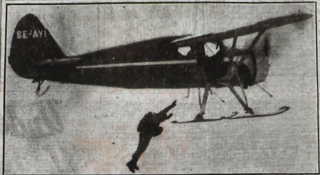
Förste man vid de frivilliga fallskärms hoppningarna har just lämnat planet från 600 m höjd. Det var trångt att kvängla sig ur det lilla civilflygplanet.

Söndagen den 26 februari 1956 ★ EXPRESSEN