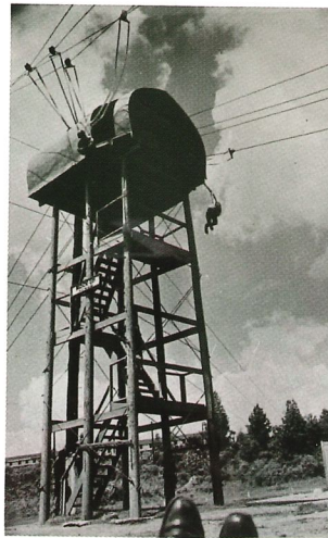
Tio meter högt övningstorn.