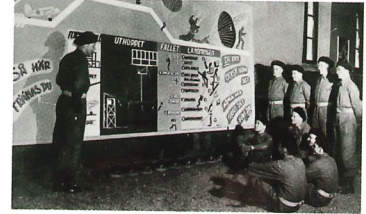
Undervisning i ridhuset.

om att det skulle gå att göra det billigare än de redan existerande utbildningarna. Efter att ha kringgått sin sektionschef som nekade förslagen om fallskärmsutbildning i svenska försvaret lyckades Carlborg få ärendet hela vägen till arméchefen Carl August Ehrenswärd som såg fördelarna med förslaget. Därmed accepterades propositionen om en försökskurs som skulle gå av stapeln ett år senare, våren 1951.