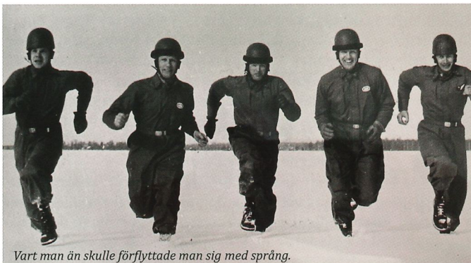
Vart man än skulle förflyttade man sig med språng.

där man övade dessa moment. När man erövrat dessa fyra moment var för sig flyttade man till nästa etapp där man övade moment ett och två tillsammans samt moment tre och fyra tillsammans. Därefter sammanflätades samtliga moment i en etapp som enligt den amerikanska utbildningsmodellen övades från 85 meter höga torn och enligt den brittiska övades från en förankrad varmluftsballong och som i Karlsborg kom att bli tio meter höga torn som byggdes på fästningsvallen. När man klarat dessa etapper med goda resultat fick man hoppa från flygplan.