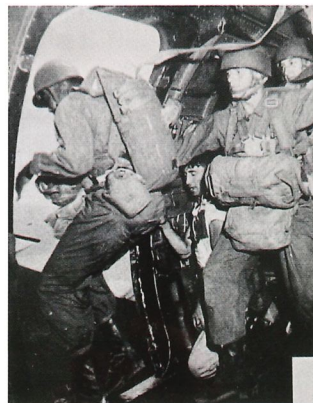
Ivriga fallskärmsjäglarelever är redo att kasta sig ut.