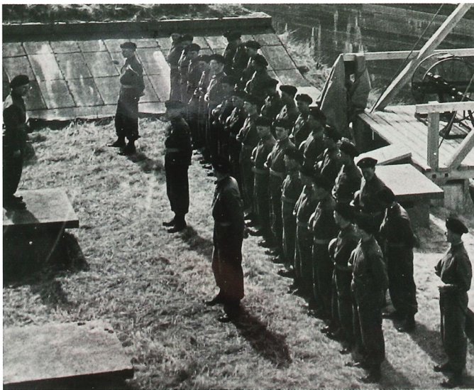
Uppställning framför uthoppstornet.