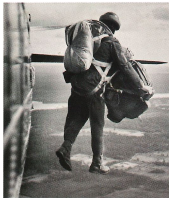
Uthopp med dåtidens ganska skrymmande fallskärmar.

I mars 1951 drog försöksutbildningen igång och den 13:e maj 1952 genomförde de 30 första värnpliktiga fallskärmsjägarna sina första hopp vid fallskärmsjägarskolan i Karlsborg. Efter ytterligare en försöksperiod blev utbildningen beständig och tusentals elitsoldater har utbildats vid Fallskärmsjägarskolan. "Örnarna" eller "örnbröderna" agerade luftlandsatt fiende i många stora övningar mot andra förband och de ska ha varit tämligen skräckinjagande och genomfört övningarna med stor realism. Med sina effektfulla vinröda