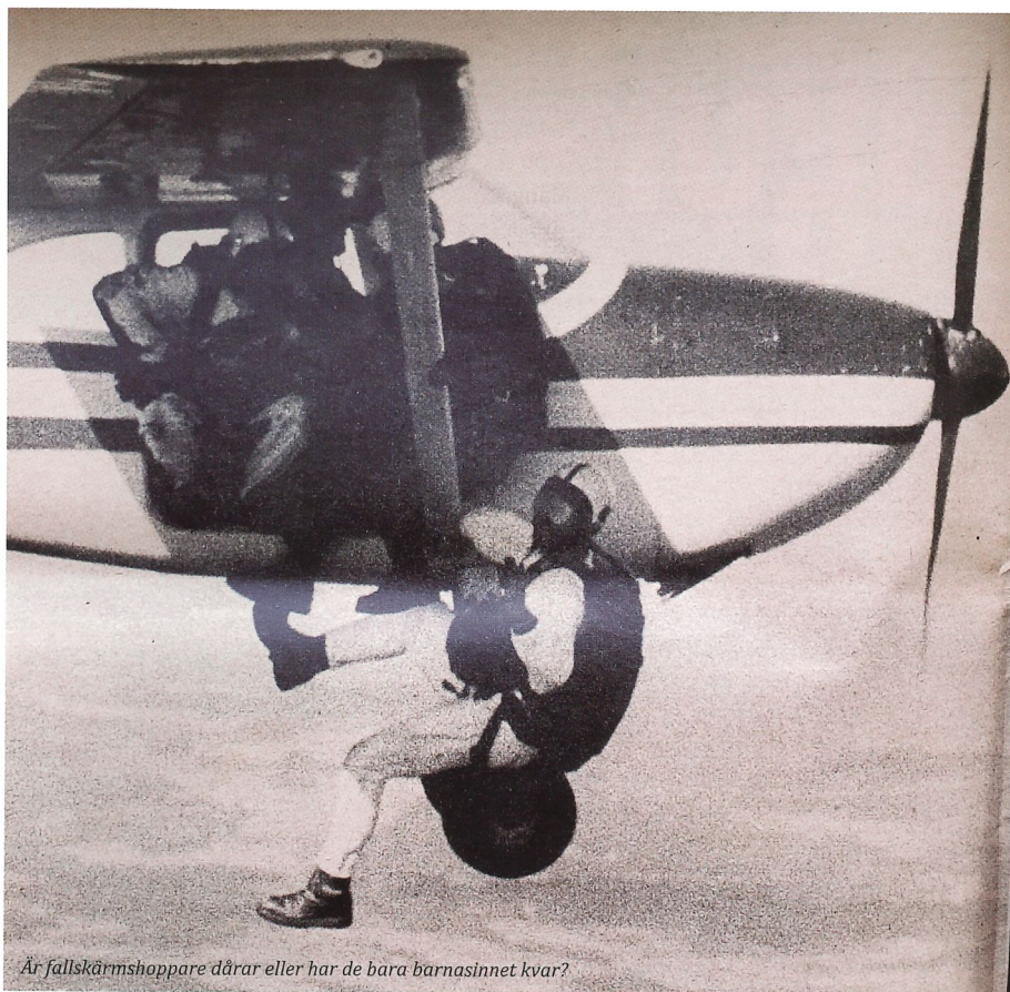
Är fallskärms hoppare dårar eller har de bara barnasinnet kvar?