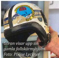
Göran visar upp sin gamla fallskärms hjälm.