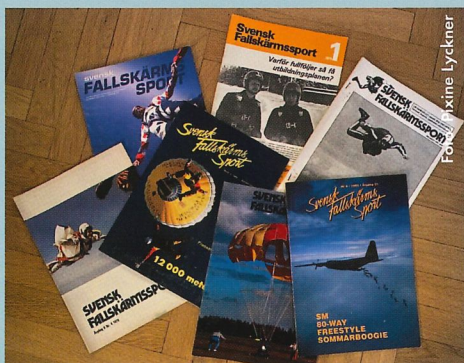
Tidningen du just nu håller i din hand, eller läser på en skärm, har många år på nacken, första numret kom ut 1972 och i det kan man läsa om en planerad charterresa till VM i USA, hur många hopp som genomförts i landet och om sportens internationella utveckling.

Visst saknar paret hoppningen ibland men än idag lever de båda väldigt aktiva liv. De är sedan en tid tillbaka bosatta i Olympic Peninsula, två timmar väster om Seattle, där de älskar att vandra i skog och berg, paddla kajak och utforska nya platser i Pacific Northwest. ”Det gäller att köra tills det tar stopp!” avslutar han