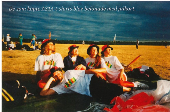
De som köpte ASTA-t-shirts blev belönade med julkort.