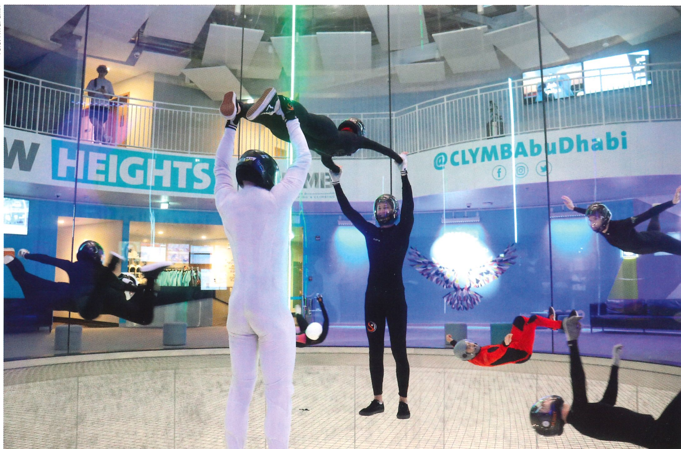
Gott om plats för många att flyga och göra olika saker samtidigt!