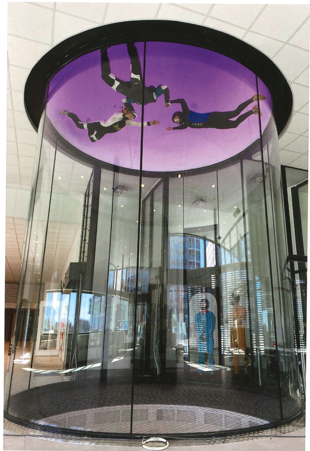
Vindtunneln på LEAP i Malmö är en ISG konstruktion.