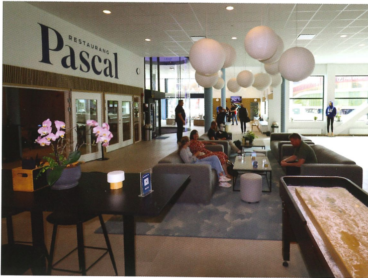
Härlig och avkopplande loungekänsla utanför egna restaurangen Pascal.