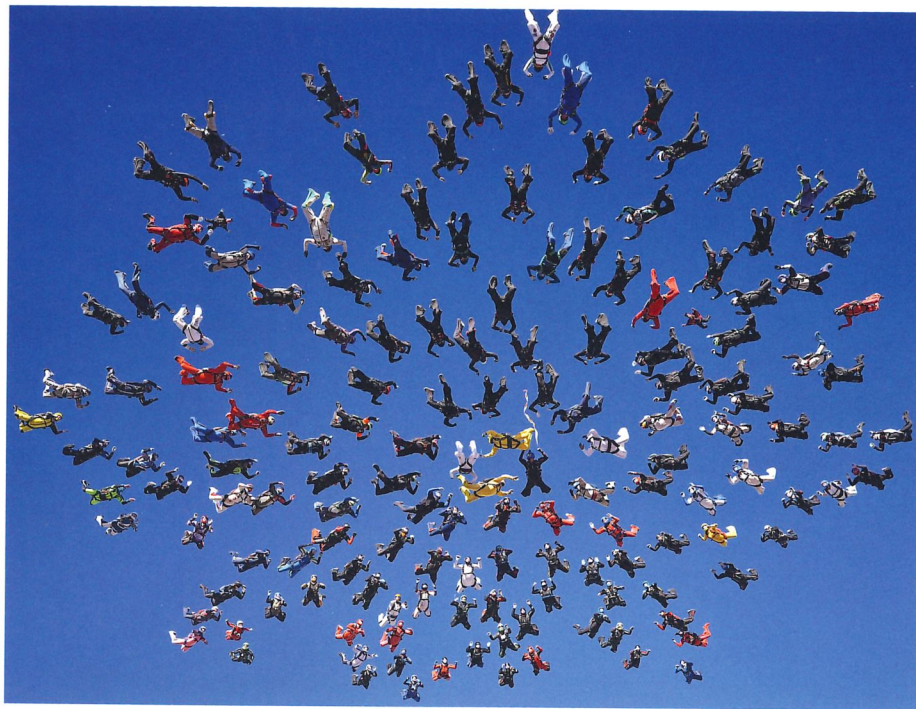
Mellan formationerna måste samtliga grepp släppas innan grepp i nästa formation tas.